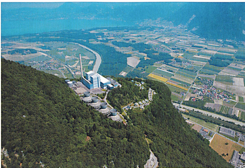
Figure 1 L'usine de Chavalon

La centrale projetée fera, elle, appel à une technologie complètement différente. Il s'agira de la première centrale à cycle combiné en Suisse et sa puissance sera de quelque 400 MW (contre 2x142 MW pour l'ancienne Chavalon). L'investissement prévu est d'environ CHF 340 millions, pour une production annuelle d'électricité de près de 2,2 milliards de kilowattheures (2,2 TWh). Cette quantité d'énergie permettrait d'alimenter l'équivalent de 460 000 ménages.