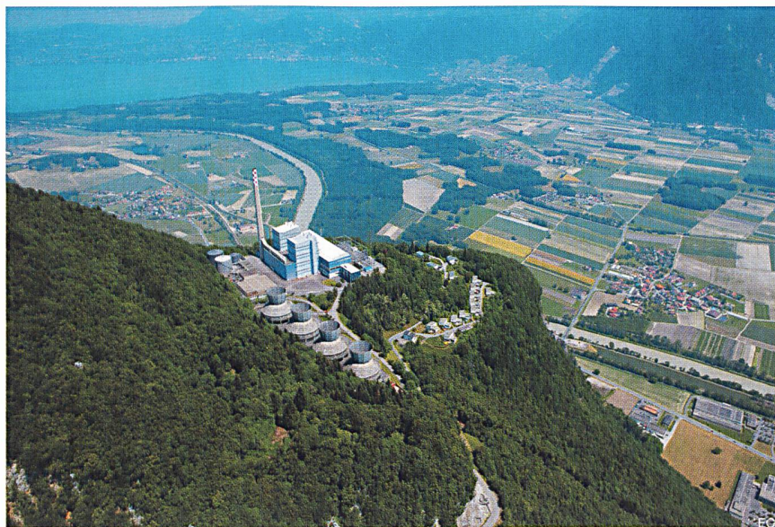
Figure 1 L'usine de Chavalon

La centrale projetée fera, elle, appel à une technologie complètement différente. Il s'agira de la première centrale à cycle combiné en Suisse et sa puissance sera de quelque 400 MW (contre 2x142 MW pour l'ancienne Chavalon). L'investissement prévu est d'environ CHF 340 millions, pour une production annuelle d'électricité de près de 2,2 milliards de kilowattheures (2,2 TWh). Cette quantité d'énergie permettrait d'alimenter l'équivalent de 460 000 ménages.