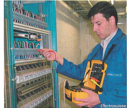
Figure 1 Contrôle final selon les normes sur les installations à basse tension

La teneur d'un contrôle périodique selon OIBT doit être adaptée aux conditions locales. Les mesures de protection (protection de base, protection en cas de défaut et protection complémentaire) doivent au moins être contrôlées, visuelle-