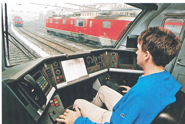
Lokomotivführer sind oft Magnetfeldern ausgesetzt.

Seit Jahren wird untersucht, ob niederfrequente Magnetfelder ein Gesundheitsrisiko darstellen. In den Neunzigerjahren hat die Universität Bern im Rahmen einer Studie festge-