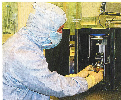
Nanotechnologie im Labor: Die Medizin erhofft sich neue Medikamente von diesen kleinsten Teilchen.

Der Schweizer Beitrag an die Kosten des 7. FRP berechnet sich anhand des BIP der Schweiz. Er beläuft sich mit rund CHF 2,360 Mia. auf einen Anteil von 2,8 Prozent der Gesamtkosten von knapp 55 Milliarden Euro. Der bei den eidgenössischen Räten beantragte Verpflichtungskredit von insgesamt CHF 2,545 Mrd. enthält auch Finanzmittel für nationale Begleitmassnahmen und für eine Beteiligung am internationalen Projekt ITER/Broader Approach (Zusammenarbeit Europa – Japan im Bereich der Fusionsforschung) und schliesst eine Reserve für BIP- und Wechselkursschwankungen über die sieben Jahre ein.