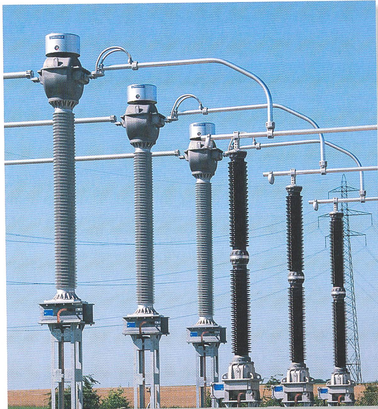
Poste de Crans (JOF300 et ECF300)

Schweizer Präzision im weltweiten Einsatz für Schutz- und Mess- zwecke in Stromnetzen bis 525 kV