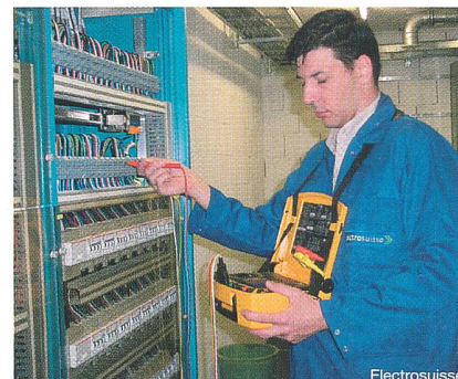
Bild 1 Schlusskontrolle nach der Niederspannungsinstallationsnorm

Der Prüfinhalt einer periodischen Kontrolle gemäss NIV ist auf die örtlichen Verhältnisse abzustimmen. Im Minimum sind die Schutzmassnahmen (Basis-, Fehler- und Zusatzschutz) zu