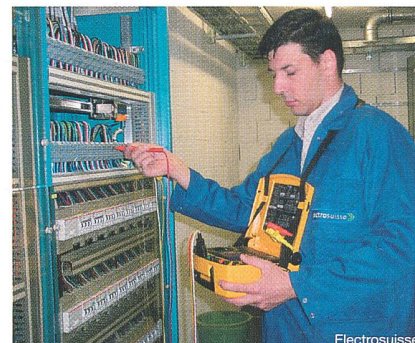
Bild 1 Schlusskontrolle nach der Niederspannungsinstallationsnorm

Der Prüfinhalt einer periodischen Kontrolle gemäss NIV ist auf die örtlichen Verhältnisse abzustimmen. Im Minimum sind die Schutzmassnahmen (Basis-, Fehler- und Zusatzschutz) zu