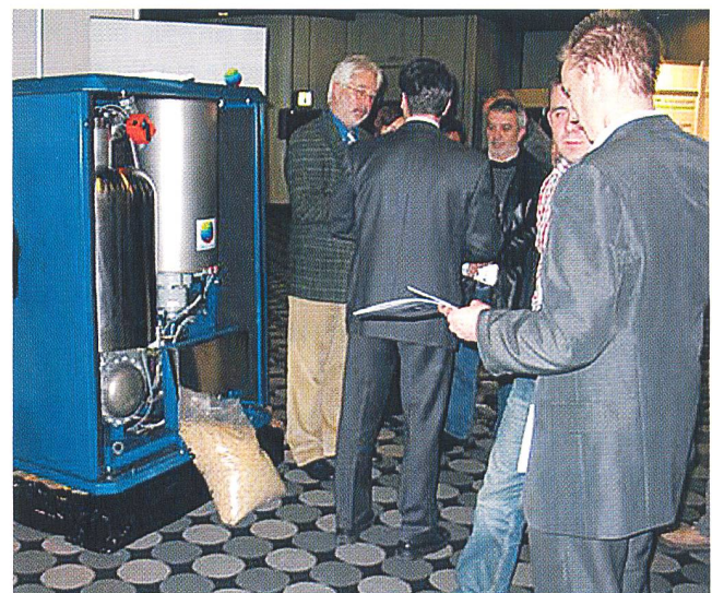
Fachausstellung 2006 Clean Energy Power (Bild: reeco).

REECO GmbH, Unter den Linden 15, D-72762 Reutlingen, Tel.: 0049 7121 30160, www.energiemessen.de .