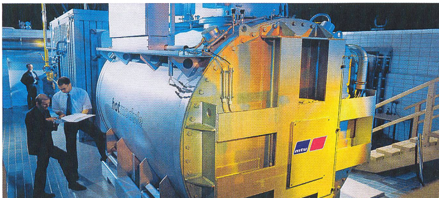
HotModule (mit bis zu 245 kW el und 170 kW th ) von MTU CFC Solutions.

Über die reine Kraftwerksfunktion hinaus geht Honda (Japan) mit seiner 2003 erstmals vorgestellten «Heimenergiestation», die gemeinsam mit Plug Power entwickelt wurde. Der dabei aus Erdgas gewonnene Wasserstoff versorge nach Angaben des Unternehmens zum einen auf Basis einer PEM-Brennstoffzelle einen Haushalt mit Strom und Warmwasser, zum anderen könnten damit direkt an der Station Wasserstofffahrzeuge betankt werden. Mit der nun vorliegenden dritten Generation sei die Leistungsfähigkeit erheblich gesteigert worden, bei deutlich geringeren Abmessungen. Auch die Startzeit der Heimenergiestation habe weiter abgenommen, sie sei nun bereits nach einer Minute funktionsbereit. Durch den gespeicherten Wasserstoff könne die Station zudem bei Energieausfällen mit 5 kW Leistung als Notgenerator dienen. Das weitere Geschehen bei Brennstoffzellen-Kraftwerken bleibt spannend.