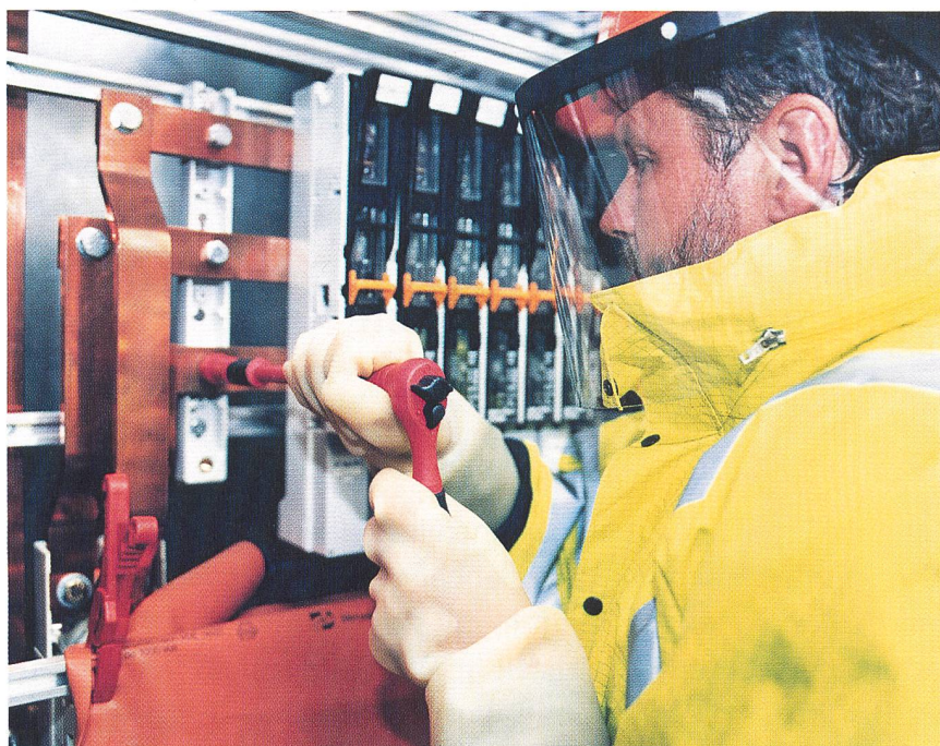
Bild 2 Eine zu hohe Arbeitsbelastung kann sich negativ auf die notwendige Konzentration auswirken: Ausreichende Schutzvorkehrungen können dies nicht wettmachen

Mit Verfügung vom 25. Mai 2004 wies die REKO/INUM 5) die Beschwerde ab. In Bezug auf die behauptete fehlende gesetzliche Grundlage für ein Gespräch mit dem fachkundigen Leiter führte sie aus, weder die NIV noch das EleG 6) enthielten Vorschriften über das Verfahren zur Erteilung einer Installationsbewilligung. Die Vorgehensweise zur Feststellung des erheblichen Sachverhalts bzw. des Vorliegens der massgeblichen Bewilligungsvoraussetzungen richte sich deshalb nach den allgemeinen Grundsätzen von Art. 7 ff. VwVG 7) , wobei das ESTI bei der Wahl der Beweismittel nicht an den im Art. 12 VwVG vorgesehenen Katalog (Urkunden, Auskünfte der Parteien, Auskünfte oder Zeugnis von Drittpersonen, Augenschein und Gutachten von Sachverständigen) gebunden sei. Gebe es Zweifel darüber, ob eine Person die technische Aufsicht über die Installationsarbeiten noch wirksam ausüben könne, sei ein persönliches Gespräch ein taugliches Beweismittel, um diese Frage zu klären.