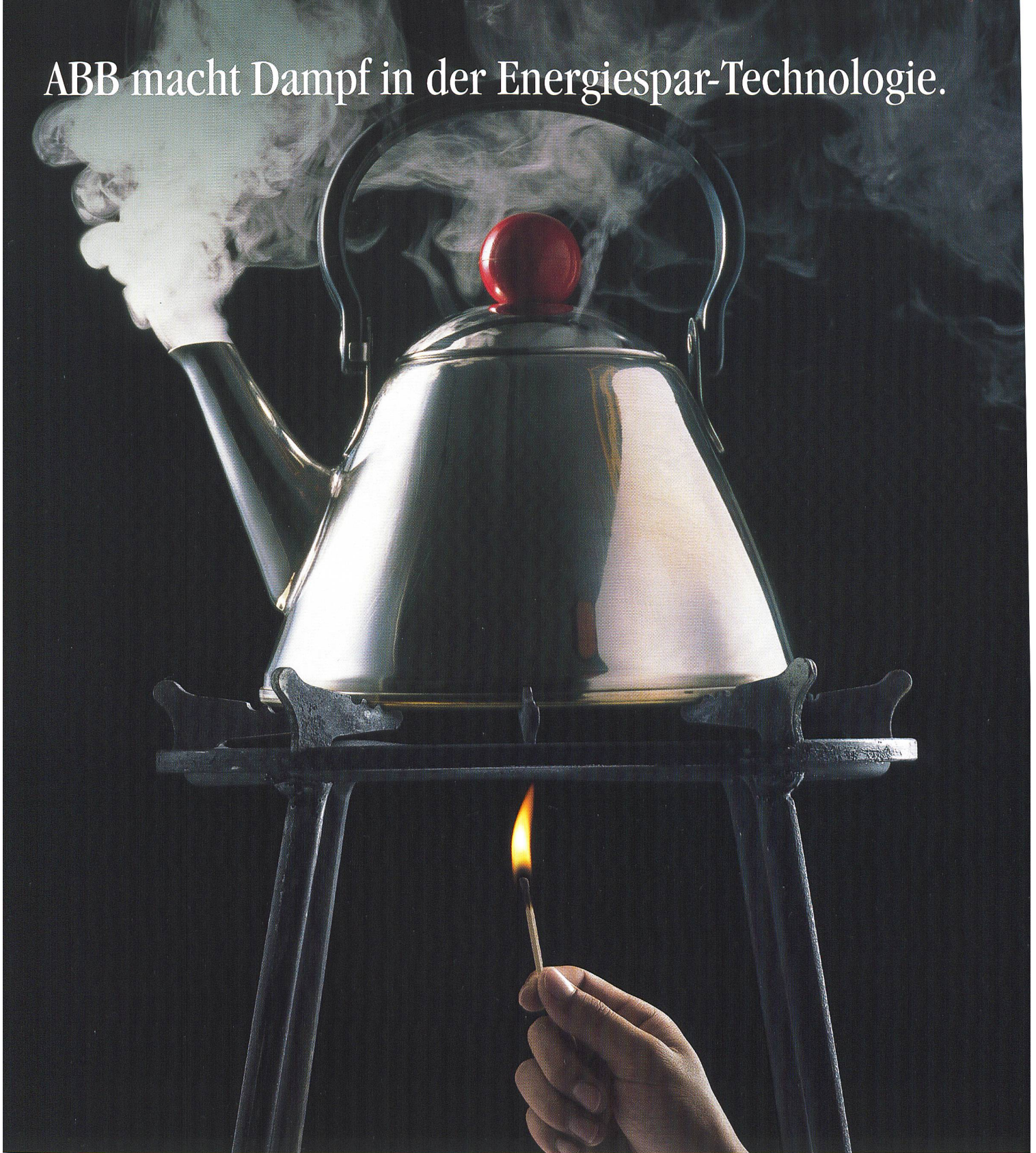
ABB macht Dampf in der Energiespar-Technologie.

Höhere Effizienz im Umgang mit Ressourcen bei gleichzeitiger Produktivitätssteigerung – ABB ist in der Schweiz auf diesem Weg mit weltweit führenden energiesparenden Lösungen dabei. Erfahren Sie mehr über ABB und ihre Energie- und Automatisierungstechnologien unter www.abb.ch