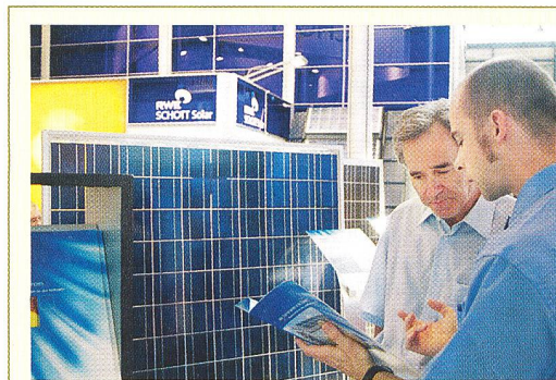
Treffpunkt der Solarbran- che.