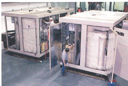
Die United Technology-ONSI-200-kW-Anlage in der Polizeistation im Central Park von New York hat bereits über 60 000 Stunden mit dem ersten Stapel.