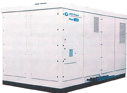
200-kW-PureCell-Anlage mit phosphorsaurem Elektrolyt. Die insgesamt 288 Anlagen erreichten total rund 1100 Mio. kWh und 7 Mio. Betriebsstunden.

Anlage wurde nach der Reparatur Anfang 2001 bei RWE in Essen wieder in Betrieb genommen und 4000 Stunden lang mit der ursprünglichen Leistung und unvermindertem Wirkungsgrad betrieben. Sie wurde dann in Pittsburgh gründlich analysiert, überholt und läuft nun seit 7000 Stunden in Turin in Italien. Auch am dritten Standort arbeitet die Anlage immer noch so gut wie am ersten Tag in den Niederlanden. Statt der nominell 100 kW liefert sie bei einem elektrischen Wirkungsgrad von fast 50% im Schnitt 109 kW und etwa 50 kW nutzbare Abwärme.