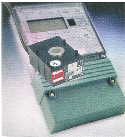
Transformateur d'intensité de Weber

Des compteurs avec introduction en amont de plus de 80 A sont généralement raccordés à un dispositif transformateur. Cette manière de procéder était jusqu'à présent complexe et nécessitait beaucoup de place. L'installation et le montage des transformateurs d'intensité sont aujourd'hui fortement simplifiés grâce à cette nouveauté de Weber ciblée sur la pratique. Cette nouvelle solution peut être utilisée pour les mesures d'énergie avec des compteurs électroniques. Le système Vertigroup permet une installation du transformateur sans perte de place. Un kit permet de monter les trois transformateurs de courant sur Silas et Tembreak. Les tâches de montage complexes appartiennent ainsi au passé, et des mesures par transformateurs peuvent être désormais effectuées dans des emplacements restreints. De nombreuses variantes de transformateurs d'intensité sont disponibles: étalonnés