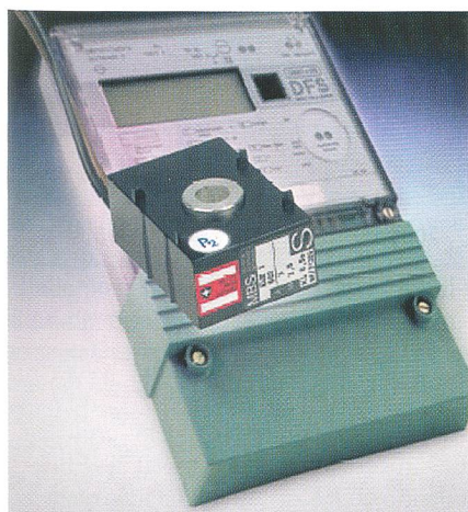
Transformateur d'intensité de Weber

Schleupen AG, D-31515 Wunstorf, Tel. +49 5031 963 330, www.schleupen.de