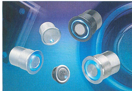
Jetzt auch mit blauer Beleuchtung: vandalensichere Taster von Schurter

Schurter bietet die vandalengeschützten Taster mit Hub- und Piezotaster jetzt auch in Kombination mit blauer Beleuchtung an. Für Geräte mit Nachtdesign wird die Betätigungsfläche durch die Beleuchtung optisch gekennzeichnet. Diese kann auch zur optischen Rückmeldung oder zum Anzei-