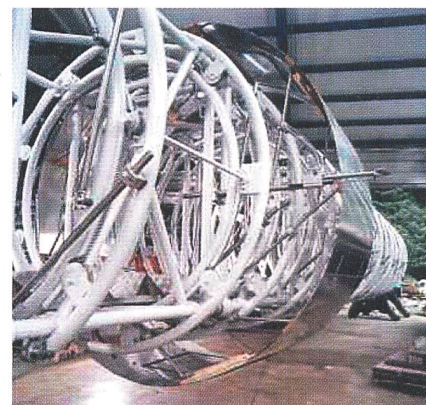
Le gabarit en cours de montage.

Un mandat de contrôle non destructif des soudures du puits blindé a également été lancé (voir l'appel d'offres). Il permettrait, selon la variante choisie, de garantir le bon état du puits existant sur les parties qui seront intégralement ou par-