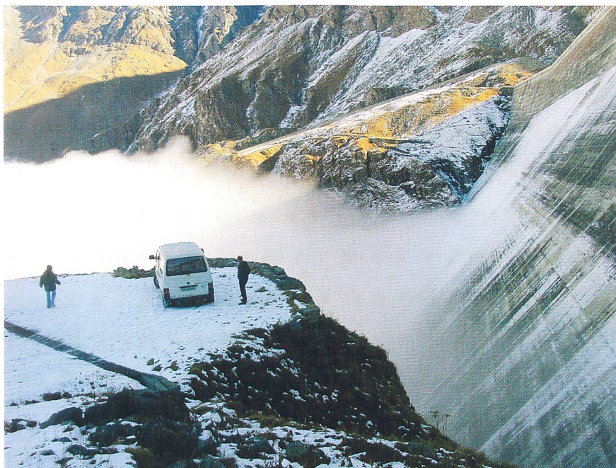
Barrage de Grande Dixence.

Les responsables de Cleuson-Dixence Construction SA ont présenté le projet de réhabilitation qui a été mis à l'enquête. Le principe général retenu est celui d'un chemisage intérieur: une nouvelle conduite forcée, d'un diamètre plus petit, sera placée à l'intérieur du tube existant. Cette nouvelle conduite sera entièrement auto-portante. C'est-à-dire que les contraintes de service de l'aménagement seront 1,8 fois inférieures à celles qu'il sera en mesure de supporter. Cinquante mètres avant la zone de l'accident et jusqu'à trente mètres après, une galerie nouvelle sera construite. Verticale sur 68 mètres puis horizontale sur 100 mètres, elle sera entièrement séparée du milieu perturbé par l'accident.