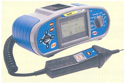
Metrel Eurotest XE: handliches Installationsprüfgerät von Elko

Eurotest XE ist ein typisches Beispiel für die neuen Metrel-Installations-Prüfgeräte von Elko. Besonders ins Auge stechen die