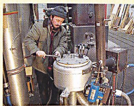
Forschung und Entwicklung im Bereich Energie aus Biomasse.