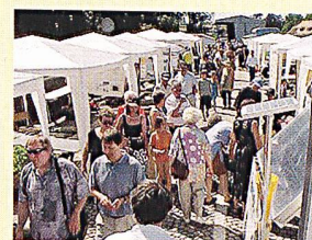
Informationsmarkt im Ökozentrum Langenbruck.