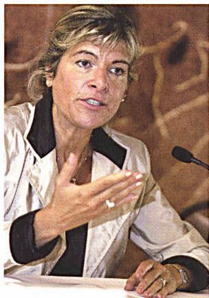
Anna Lauvergeon.

(nf) Im aktuellen Umfeld ist die Schweiz gut beraten, wenn sie ihre heutige, vorbildliche Energiepolitik fortführt. Im Bereich der Stromerzeugung heisst das, heute und morgen der Kernenergie eine bedeutende Rolle einzuräumen. Nur so lassen sich die Forderungen nach Versorgungssicherheit, kostengünstiger Stromproduktion und Klimaschutz unter einen Hut bringen. Dies empfahl Anna Lauvergeon, Direktionspräsidentin von Areva, an der Generalversammlung des Nuklearforums Schweiz in Bern am 23. September. Areva ist ein