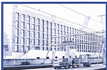
Hintere Bahnhofstrasse 10