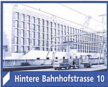
Hintere Bahnhofstrasse 10