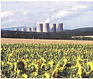
Im Süden der Slowakei befinden sich vier Blöcke des Kernkraftwerks Mochovce mit den Druckwasserreaktoren Typ VVER 440/V 213, jeder mit einer Leistung von 440 MWe.