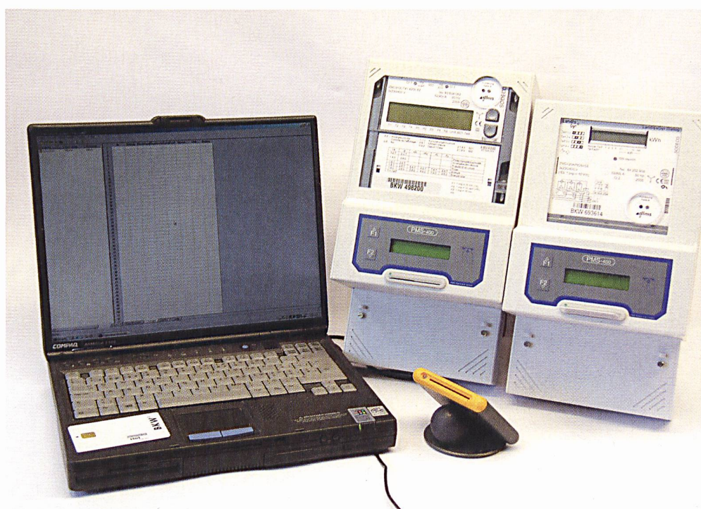
Bild 1 Systemkomponenten.

Parallel zur technischen Einführung und der Anwenderschulung sollte auch der bis dahin in den Regionalvertretungen unterschiedlich gelöste Inkassoprozess vereinheitlicht werden. Es nahm viel Zeit in Anspruch, diesen Prozess zu erstellen. Die Anwenderschulung in den Regionalvertretungen wurde schliesslich von Frühling bis Herbst 2004 durchgeführt. Die gewählte Art der Schulung, eine Mischung aus Frontalunterricht und