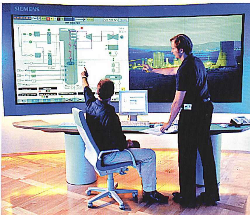
Im Remote Expert Center für Kraftwerke in Karlsruhe können Siemens-Experten ganze Anlagen aus der Ferne überprüfen, warten und optimieren.

fischen Kohlendioxid-Emissionen. Mit zielgerichteter Diagnose können wir Stellen erkennen, die für einen gesunkenen Wirkungsgrad verantwortlich sind oder wo ein Verschleisssteil ersetzt werden muss. Noch vor etwa zehn Jahren haben wir regelmässig die Turbine in ihre Einzelteile zerlegt und wieder zusammengebaut. Jetzt sehen wir dank der Diagnosen, dass wir die komplette Überprüfung einer Turbine noch gar nicht brauchen. So konnten wir bei den Blöcken der Grundlastkraftwerke die Intervalle für eine Revision, also die komplette Überprüfung, deutlich verlängern. Früher haben wir das alle drei bis sechs Jahre gemacht, heute nur noch alle vier bis acht Jahre.