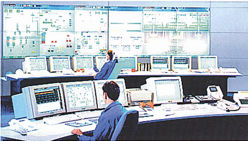
Leitwarte Schwarze Pumpe: Fachleute können das Vattenfall-Kraftwerk in Ostdeutschland aus der Ferne beobachten und bei Problemen Hilfestellung geben.