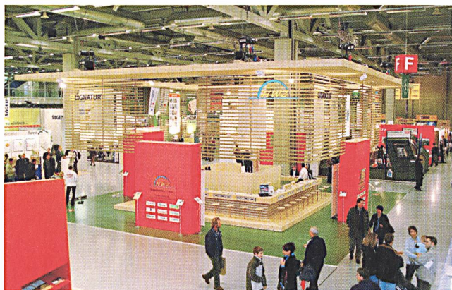
Die 4. Schweizer Hausbau- und Minergie-Messe 2003 endete in Bern mit einem Aussteller- und Besucherrekord.

Über 4000 Minergie-Bauten bestätigen die energieeffiziente Bauweise für mehr Komfort und weniger Betriebskosten. Wärmedämmung der Gebäudehülle und Abwärmenutzung mit kontrollierter Lüftung sind zwei wesentliche Kriterien des Baukonzepts. Wie man zukunftsorientiert planen und bauen kann, zeigt die 5. Schweizer Hausbau- und Minergie-Messe vom 1. – 4. Dezember an der BEA bern expo in Bern. Bauten im Minergie-Standard bieten beides: nachhaltiges Baukonzept und viel Komfort.