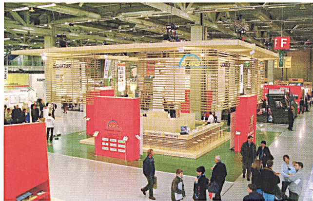
Die 4. Schweizer Hausbau- und Minergie-Messe 2003 endete in Bern mit einem Aussteller- und Besucherrekord.

Über 4000 Minergie-Bauten bestätigen die energieeffiziente Bauweise für mehr Komfort und weniger Betriebskosten. Wärmedämmung der Gebäudehülle und Abwärmenutzung mit kontrollierter Lüftung sind zwei wesentliche Kriterien des Baukonzepts. Wie man zukunftsorientiert planen und bauen kann, zeigt die 5. Schweizer Hausbau- und Minergie-Messe vom 1. – 4. Dezember an der BEA bern expo in Bern. Bauten im Minergie-Standard bieten beides: nachhaltiges Baukonzept und viel Komfort.