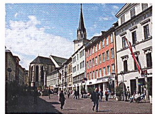
Villach im österreichischen Kärnten.