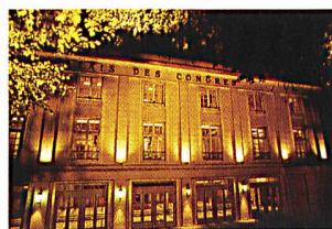
Palais de Congrès, Paris.