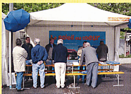
Verschiedene Aktionen machten auf die Nutzung der Sonnenenergie aufmerksam.