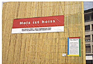
Rohstoff Holz mitten in Basel.

Vom 17. bis 22. Juni fand in Basel das 8. Internationale Energieforum sun21 statt: sun21 Panel, rallye21, Biomassegipfel und die Events auf dem «Barfi» sind einige der Highlights am Forum für Energieeffizienz und erneuerbare Energie.