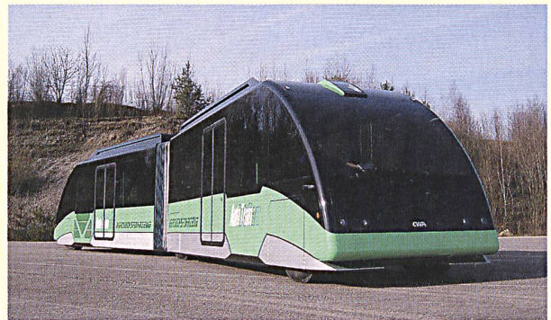
Das AutoTram hält auch ohne Schienen exakt die Spur.

Eine Strassenbahn, die keine Schienen braucht, sondern wie ein Bus über die Strassen fährt – ein neuartiges Fahrzeugkonzept macht es möglich. Das AutoTram kombiniert die Vorzüge von Bahnen und Bussen: Es kann bis zu 300 Fahrgäste transportieren und ist dennoch so flexibel wie ein Bus. Weiterer Vorzug: Das AutoTram wird umweltfreundlich mit einer 80-kW-Brennstoffzelle angetrieben. Das Fraunhofer-Institut für Verkehrs- und Infrastruktursysteme IVI in Dresden stellte kürzlich auf seinem Versuchsgelände das neuartige Erprobungsfahrzeug dem Fachpublikum vor.