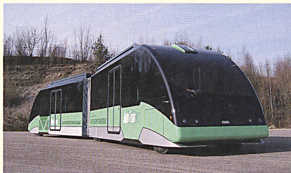
Das AutoTram hält auch ohne Schienen exakt die Spur.

Eine Strassenbahn, die keine Schienen braucht, sondern wie ein Bus über die Strassen fährt – ein neuartiges Fahrzeugkonzept macht es möglich. Das AutoTram kombiniert die Vorzüge von Bahnen und Bussen: Es kann bis zu 300 Fahrgäste transportieren und ist dennoch so flexibel wie ein Bus. Weiterer Vorzug: Das AutoTram wird umweltfreundlich mit einer 80-kW-Brennstoffzelle angetrieben. Das Fraunhofer-Institut für Verkehrs- und Infrastruktursysteme IVI in Dresden stellte kürzlich auf seinem Versuchsgelände das neuartige Erprobungsfahrzeug dem Fachpublikum vor.