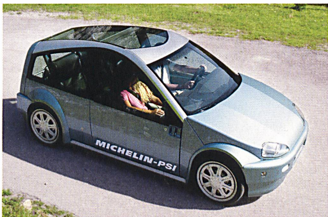
In allen Technologiebereichen konnten 2004 wichtige Erfolge erzielt werden. Besondere Highlights waren dabei die Demonstration des Brennstoffzellen-Autos Hy-Light.

(bfe) Die ETH Zürich hat am Shell Eco-Marathon in Ladoux (Frankreich) einen sensationellen Weltrekord aufgestellt: der mit Wasserstoff und Brennstoffzellen betriebene PAC-Car II legte mit einem Energieverbrauch von umgerechnet einem Liter Benzin ganze 5385 Kilometer zurück. PAC-Car II ist ein gemeinsames Projekt der ETH Zürich zusammen mit dem Bundesamt für Energie (finanzielle Unterstützung), dem Paul Scherrer Institut und den Industriepartnern ESORO, RUAG und Tribecraft.