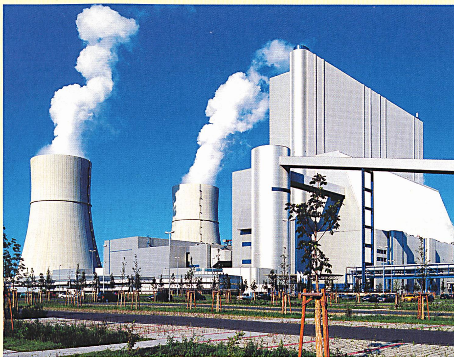
Braunkohle-Kraftwerk Schwarze Pumpe. Daneben entsteht die Pilotanlage für ein CO 2 -freies Kohlekraftwerk.

Damals betrug der Wirkungsgrad dieser Anlagen im Mittel 20%. Mit einem Investitionsprogramm von rund 40 Milliarden Euro wird bis 2020 im Kraftwerksbereich wieder ein Effizienzschub bewirkt. Neu gebaute Steinkohlekraftwerke arbeiten bereits mit 45% Wirkungsgrad. Erdgasanlagen mit kombinierten Gas- und