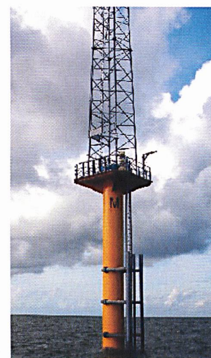
70 m hoher Mast für Windmessungen an der Themsemündung (Seacore).

Gebaut werden sollen die Turbinen auf Plattformen nahe der Themsemündung in die Nordsee. Sollte die Regierung das London Array-Projekt bis Ende 2006 genehmigen, könnte es bis 2010 oder 2011 fertig gestellt sein. An dem 1,5 Mrd. Pfund-Projekt (3,4 Mrd. Franken) sind ausserdem Deutschlands grösster Energieversorger E.ON und das Joint-Venture-Unternehmen Core beteiligt.