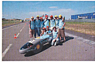
Das Team nach dem Weltrekord.

Für die Energieforschung bleiben die Sporbemühungen der öffentlichen Hand und der Privatwirtschaft auch im Geschäftsjahr 2004 nicht ohne Konsequenzen. Die Kürzung der Mittel des Bundesamtes für