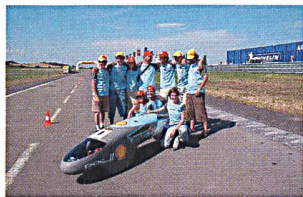
Das Team nach dem Weltrekord.

Für die Energieforschung bleiben die Sporbemühungen der öffentlichen Hand und der Privatwirtschaft auch im Geschäftsjahr 2004 nicht ohne Konsequenzen. Die Kürzung der Mittel des Bundesamtes für