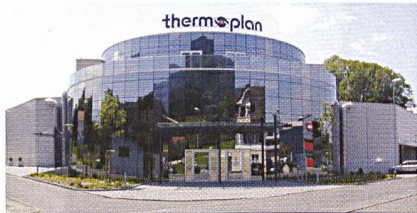
Werk II in Weggis

1990 baute die Thermoplan AG ihr erstes Produktions- und Bürogebäude in Weggis. Auf Grund des schnellen Wachstums und der Partnerschaft mit Starbucks, Seattle, wurde im Jahr 2001 ein zweites Werk in Weggis erstellt. In St.-Pierre-de-Clages (VS) entstand 2002 schliesslich das «Crea-