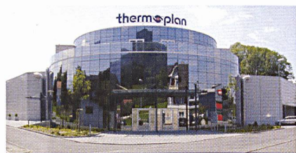
Werk II in Weggis

1990 baute die Thermoplan AG ihr erstes Produktions- und Bürogebäude in Weggis. Auf Grund des schnellen Wachstums und der Partnerschaft mit Starbucks, Seattle, wurde im Jahr 2001 ein zweites Werk in Weggis erstellt. In St.-Pierre-de-Clages (VS) entstand 2002 schliesslich das «Crea-