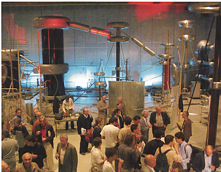
Vor der imposanten Kulisse des ETH-Hochspannungslabors war der Geist von Nikola Tesla förmlich spürbar.

An der nächsten «Soirée électrique» wird Prof. Karlheinz Brandenburg vom Fraunhofer-Institut und Vater des Musikdateiformats MP3 erläutern, wie er vor bald 20 Jahren einen Algorithmus entwickelt hat, der die Datenmenge von elektronischen Musikdateien ohne hörbaren Qualitätsverlust um 85% verringert. (RuF)