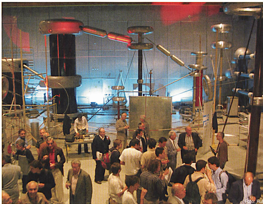
Vor der imposanten Kulisse des ETH-Hochspannungslabors war der Geist von Nikola Tesla förmlich spürbar.

An der nächsten «Soirée électrique» wird Prof. Karlheinz Brandenburg vom Fraunhofer-Institut und Vater des Musikdateiformats MP3 erläutern, wie er vor bald 20 Jahren einen Algorithmus entwickelt hat, der die Datenmenge von elektronischen Musikdateien ohne hörbaren Qualitätsverlust um 85% verringert. (RuF)