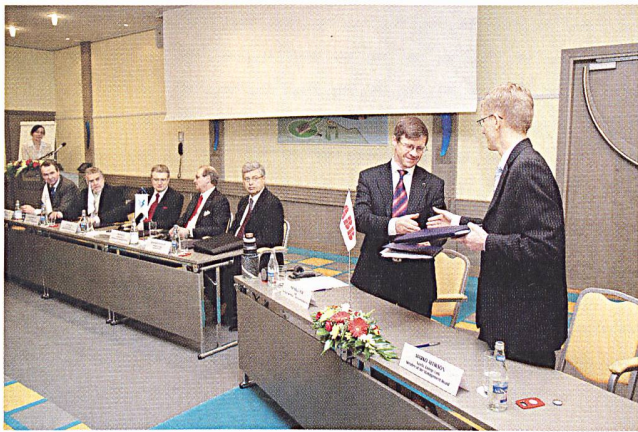
Estlink-Projekt: Feierliche Unterzeichnung in der estnischen Hauptstadt Tallinn.

km der Verbindung verlaufen unter Wasser, der Rest als Erdkabel (9 km in Estland und 20 km in Finnland). Unter Verwendung der HVDC-Light-Technologie von ABB (Hochspannungs-Gleichstromübertragungsleitung) wird die 330-kV-Unterstation Harku in Estland mit der 400-kV-Unterstation in Espoo in Finnland verbunden. Die Projektsumme für ABB beläuft sich auf 110 Millionen Dollar.