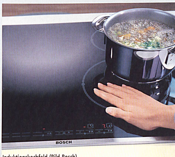
Induktionskochfeld (Bild Bosch).

Induktionskochmulden hätten im Wettlauf mit der Zeit die Nase vorn, arbeiten sie doch ganz anders als ihre «gewöhnlichen» Kollegen. Denn ob Steaks oder Pasta, Gemüse oder Pudding – alles brate und koche auf weitgehend kaltem Kochfeld. Möglich werde dies durch ein elektromagnetisches Wechselfeld, das die Wärme direkt im Topfboden des Kochgeschirrs erzeugt.