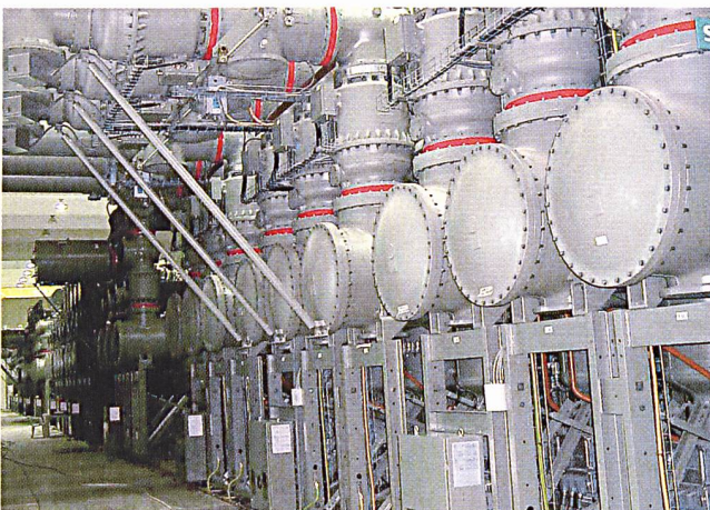
Gasisolierte Schaltanlage in einem Umspannwerk in Saudi Arabien.

Die Estlink-Stromverbindung ist rund 100 km lang; 75