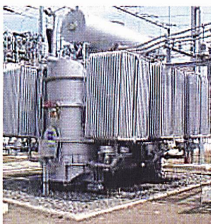
Transformatoranlage des Stromverteilers Electrica Muntenia Sud.

Die rumänische Regierung will bald die Privatisierung der Kohlekraftwerke Rovinari, Turceni und Craiova in Angriff nehmen sowie des Stromverteilers Electrica Muntenia Sud,