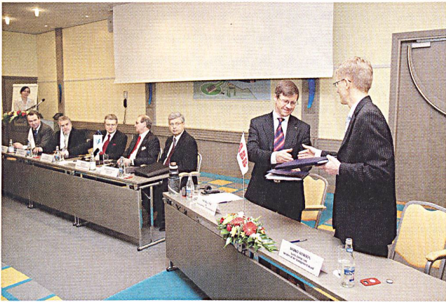
Estlink-Projekt: Feierliche Unterzeichnung in der estnischen Hauptstadt Tallinn.

km der Verbindung verlaufen unter Wasser, der Rest als Erdkabel (9 km in Estland und 20 km in Finnland). Unter Verwendung der HVDC-Light-Technologie von ABB (Hochspannungs-Gleichstromübertragungsleitung) wird die 330-kV-Unterstation Harku in Estland mit der 400-kV-Unterstation in Espoo in Finnland verbunden. Die Projektsumme für ABB beläuft sich auf 110 Millionen Dollar.