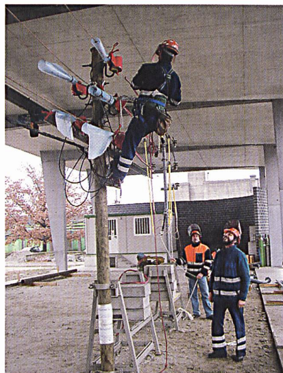
La messa in sicurezza di un posto di lavoro su una LA-BT.