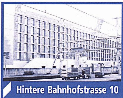
Hintere Bahnhofstrasse 10