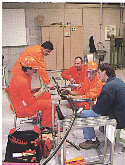
L'esecuzione di un giunto sotto tensione.

Le aziende elettriche della Svizzera Italiana sono persuase che la formazione continua non solo è indispensabile, ma rappresenta un arricchimento e una motivazione professionale e umana per tutti i collabora-