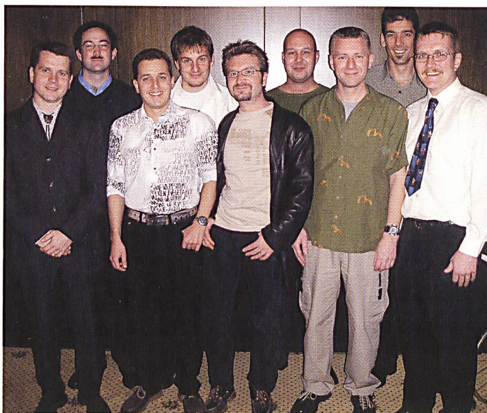
Neun der elf erfolgreichen Absolventen der Berufsprüfung 2004 für KKW-Anlagenoperateure anlässlich der Schlussfeier in der Felsenau bei Koblenz.