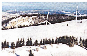
Bereits erfolgreich im Betrieb: Windkraftanlage im Jura.