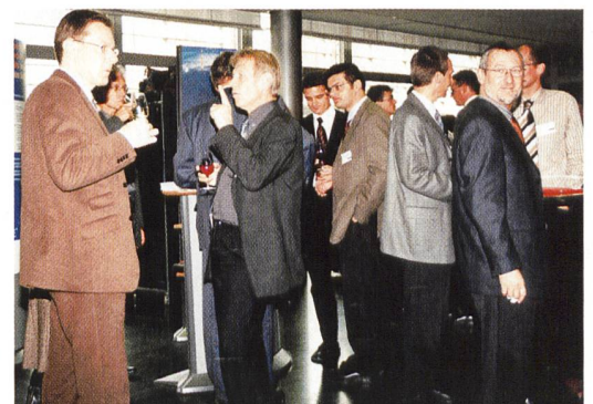
Angeregter Erfahrungsaustausch während den Pausen.

Die vom Verband Schweizerischer Elektrizitätswerke VSE in Auftrag gegebene Video-Umfrage in den Strassen von Biel und Thun zeigte deutlich, dass die Leute positiv zu Ökostrom stehen, jedoch nicht wissen, wie solcher bestellt werden kann. Natürlich sollte der Preis nicht höher als «normaler» Strom sein.