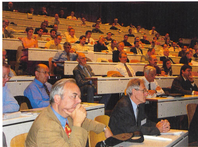
200 interessierte Zuhörerinnen und Zuhörer am SATW-Jahreskongress in Lausanne.