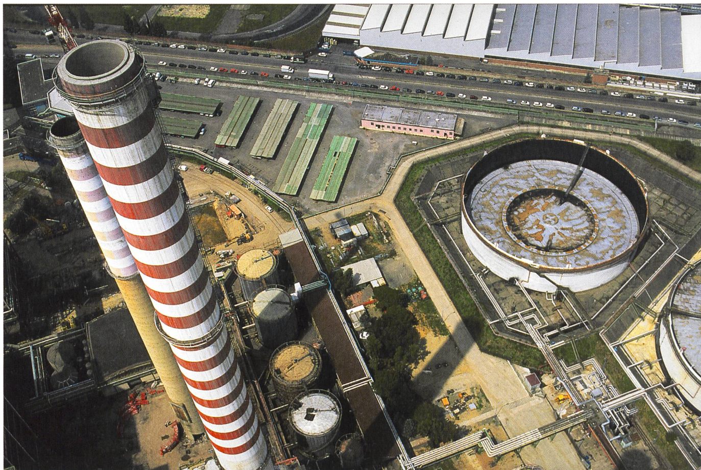
Ein erheblicher Teil der thermoelektrischen Leistung des Landes basiert auf Erdöl, das immer teurer wird (thermoelektrisches Kraftwerk La Spezia).

späteren Dekret sollen die Modalitäten für kleinere Unternehmen festgelegt werden.