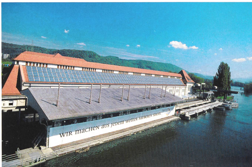
Alle EU-Staaten, auch solche, die wie die Schweiz dank Wasserkraft bereits einen hohen Anteil an umweltfreundlichen Anlagen vorweisen können, haben sich zu einer Steigerung bei der Elektrizitätsproduktion aus Erneuerbaren verpflichtet (Wasserkraftwerk am Rhein mit Photovoltaikdach).

Der Übergang zu einer reinen Marktentschädigung kann bei einem Quotensystem recht gut erfolgen, wenn die Preise auf dem Markt für «Normalstrom» oder die Zahlungsbereitschaft der Endkunden für eine alternative Stromproduktionsart steigen. Nachteilig ist, dass die letztlich arbiträre Festlegung einer Quote zu erheblichen Preisausschlägen führen kann.