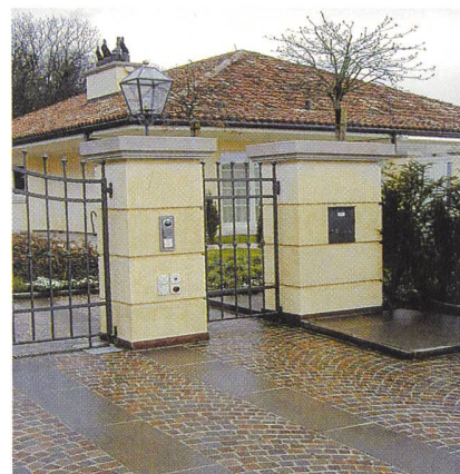
IR-Schnittstelle unauffällig beim Eingangstor.

Die Montage des IR-Fernaulesesystems ist modular aufgebaut. Das eröffnet bei der Montage vielseitige Möglichkeiten und erlaubt auch, auf die Ästhetik am Bau Rücksicht zu nehmen. So kann die IR-Schnittstelle bei der Briefkastenfront montiert werden. Auch ist die Montage an der Parzellengrenze möglich und kann