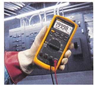
Das Echtheffektiv-Multimeter 87-5 von Fluke

Das Digitalmultimeter Fluke 87-5 löst die Probleme, die normalerweise bei der Messung an geregelten Motorantrieben auf-