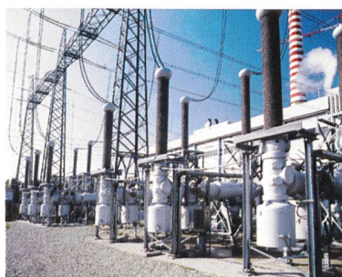
Photo de couverture: Cette installation de distribution d'électricité – associant la technique de l'isolation gazeuse à celle de l'isolation par air – a été conçue pour être implantée en extérieur et prend deux fois moins de place qu'une installation de distribution similaire isolée par air.

Bulletin SEV/VSE – Bulletin SEV/AES Zürich, 4. Juni 2004/Nr. 12 95. Jahrgang