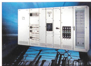
Niederspannungs-Schaltanlage Sivacon 8PT von Siemens A&D mit hinten liegenden Sammelschienen: Hohe Flexibilität für Infrastrukturmassnahmen in der Industrie und in Gebäuden

Sivacon gibt es in Festeinbautechnik, Stecktechnik und Leistungsschalteertechnik in Fest- und Einschubausführung.