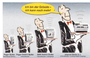
Der Internet Butler ic.1 macht's möglich: Gebäude- und Anlagenüberwachung von überall mit PC, WAP-Handy oder PDA

Die Elbro AG hat von Iconag die Generalvertretung des «Internet Butler ic.1» übernommen, der als Melde- und Fernwirkmodul sowie Kleinsteuerung und Datenlogger in einem kompakten Hutschienen-