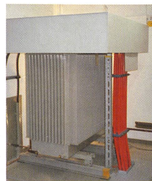
Kompakt-Abschirmssystem PowerShield von Systron EMV GmbH für Transformatoren bis 1250 kVA

Elbro AG, 8162 Steinmaur Tel. 01 854 73 00, www.elbro.com