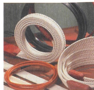
Heizkabel und -bänder von Wisag mit einem Computerprogramm für die Auslegung

Dass mit elektrischer Energie häuslicherisch umgegangen werden muss, ist allgemein bekannt. Viele Beheizungsaufgaben in der Industrie sind jedoch nach wie vor mit zu hohen Leistungen ausgelegt. Für die Beheizung mit Heizbändern und Heizkabeln bietet Wisag ein spezielles und ausgeklügeltes Rechnerprogramm an, das eine äusserst genaue und optimale Leistungsberechnung erlaubt, unter Berücksichtigung der Masse und der Werkstoffe der aufzuheizenden Teile, der gewählten Isolationen sowie der Umgebungsbedingungen. Da viele verschiedene in Behältern lagernde Produkte warm gehalten oder aufgeheizt werden müssen, ist eine individuelle Auslegung der Beheizung erforderlich. Nebst der Auswahl des geeigneten Heizelementes sind auch die Befestigungs- und Isoliersysteme von grösster Bedeutung. Nicht zu vergessen ist ein zuverlässiges Temperatur-Regelsystem, das dafür sorgt, dass auf der gesamten Fläche