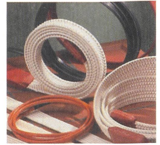
Heizkabel und -bänder von Wisag mit einem Computerprogramm für die Auslegung

Dass mit elektrischer Energie haushälterisch umgegangen werden muss, ist allgemein bekannt. Viele Beheizungsaufgaben in der Industrie sind jedoch nach wie vor mit zu hohen Leistungen ausgelegt. Für die Beheizung mit Heizbändern und Heizkabeln bietet Wisag ein spezielles und ausgeklügeltes Rechnerprogramm an, das eine äusserst genaue und optimale Leistungsberechnung erlaubt, unter Berücksichtigung der Masse und der Werkstoffe der aufzuheizenden Teile, der gewählten Isolationen sowie der Umgebungsbedingungen. Da viele verschiedene in Behältern lagernde Produkte warm gehalten oder aufgeheizt werden müssen, ist eine individuelle Auslegung erforderlich. Nebst der Auswahl des geeigneten Heizelementes sind auch die Befestigungs- und Isoliersysteme von grösster Bedeutung. Nicht zu vergessen ist ein zuverlässiges Temperatur-Regelsystem, das dafür sorgt, dass auf der gesamten Fläche