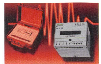
Netzanalysator MFT 6040 von Berg

Das Erfassungsgerät im DIN-Schienen-Aufschnappgehäuse enthält 640 kB internen Speicher. Die Aufteilung des verfügbaren Speicherplatzes auf die unterschiedlichen Aufgaben als Datenlogger,