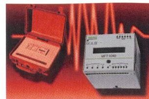
Netzanalysator MFT 6040 von Berg

Das Erfassungsgerät im DIN-Schienen-Aufschnappgehäuse enthält 640 kB internen Speicher. Die Aufteilung des verfügbaren Speicherplatzes auf die unterschiedlichen Aufgaben als Datenlogger,