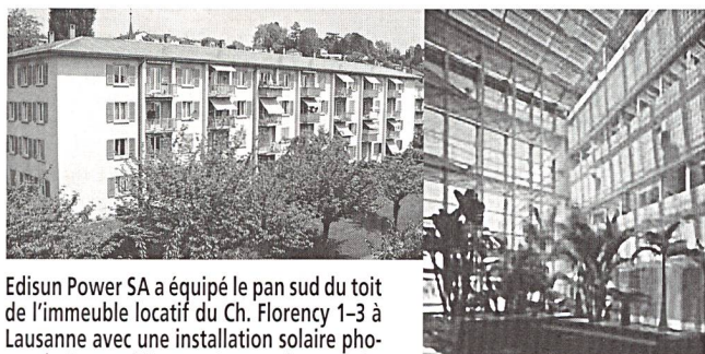
Edisun Power SA a équipé le pan sud du toit de l'immeuble locatif du Ch. Florency 1-3 à Lausanne avec une installation solaire photovoltaïque reliée au réseau, d'une puissance nominale de 38 kW et d'une surface de 300 m 2 .