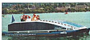
Profitierte vom Rekordsommer: das Solarboot ZHolar

ZHolar – das 6-Personen-Solarboot auf dem Zürichsee – war in den ersten beiden Betriebsjahren (2001 und 2002) je etwa 100 Stunden bzw. mit ins-