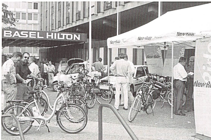
Vor allem die neuen Elektro-Velos fanden an der Ausstellung vor dem Hotel Hilton in Basel reges Interesse.