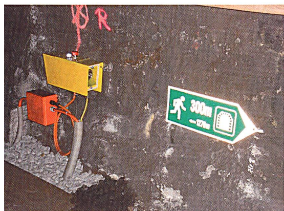
Bild 2 Steckbare Notbeleuchtung in Eisenbahntunnel mit brandfester Anschlussdose und Verkabelung sowie Fluchtwegweiser mit Distanzangabe zum nächsten Notausgang.