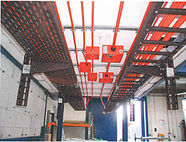
Bild 4 Prüfanordnung von Kabel, Abzweigboxen und Kabelkanälen für Brandtest/Funktionserhalt E30.