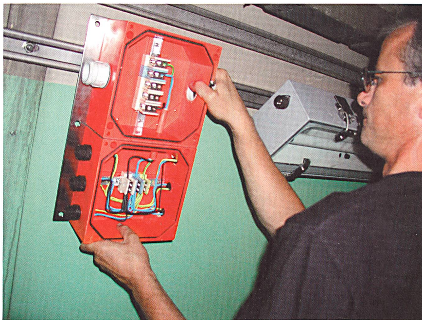
Bild 3 Montage einer Doppelabzweigdose und Notleuchte für Autobahnstrassentunnel, obere AZ-Dose zur Schlaufung, untere zur Lampenanspeisung.

Deshalb müssen solche Einrichtungen eine hohe Funktionssicherheit auch im Brandfalle gewährleisten. Brandfeste Elektroinstallationen werden in Zukunft