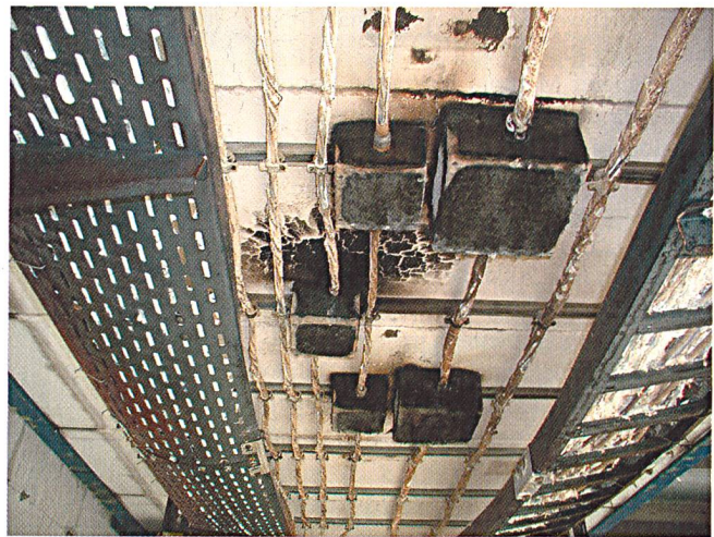
Bild 5 Anordnung wie Bild 4 nach erfolgreichem Brandtest nach DIN 4102.

zwingend zur Grundforderung in Tunnels und Gebäuden sowie Einrichtungen mit hoher Personenbelegung und begrenzten Fluchtmöglichkeiten wie zum Beispiel in Hochhäusern, Büros, Spitälern, Tunnels für Bahnen und Strassen, Flughäfen, aber auch bei hohen Konzentrationen von Sachwerten, wie EDV/Computeranlagen, Museen, Chemie, Offshore-Industrie.