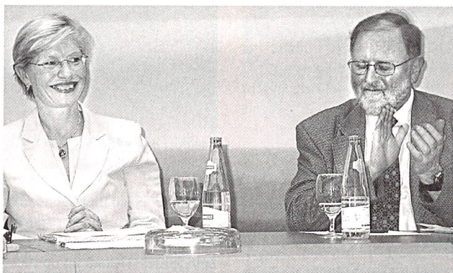
Die Nationalrätin und Zürcher Regierungsrätin Regine Aeppli, zurücktretende Präsidentin der Agentur für erneuerbare Energien und Energieeffizienz, mit ihrem Nachfolger, Nationalrat Odilo Schmid.