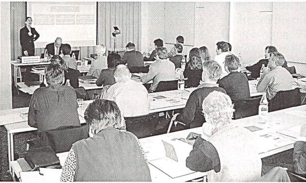
Grossandrang in den neuen Seminararräumen des VSE in Aarau (Bilder: W.Blum).