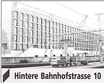
Hintere Bahnhofstrasse 10