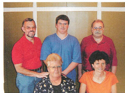
Projektteam EW Tamins.

Im März 2001 wurde die Evaluation eines neuen Finanz- und Abrechnungssystems gestartet. Der Systementscheid Simultan und easy erfolgte im Mai. Seit 1. Januar 2002 wird das System produktiv genutzt. Dank der übergeordneten Projektleitung durch die Firma EbOT AG und der guten Kooperation der gewählten Partner (easy AG, Simultan AG) konnte das Projekt im budgetierten Zeit- und Kostenrahmen realisiert werden.