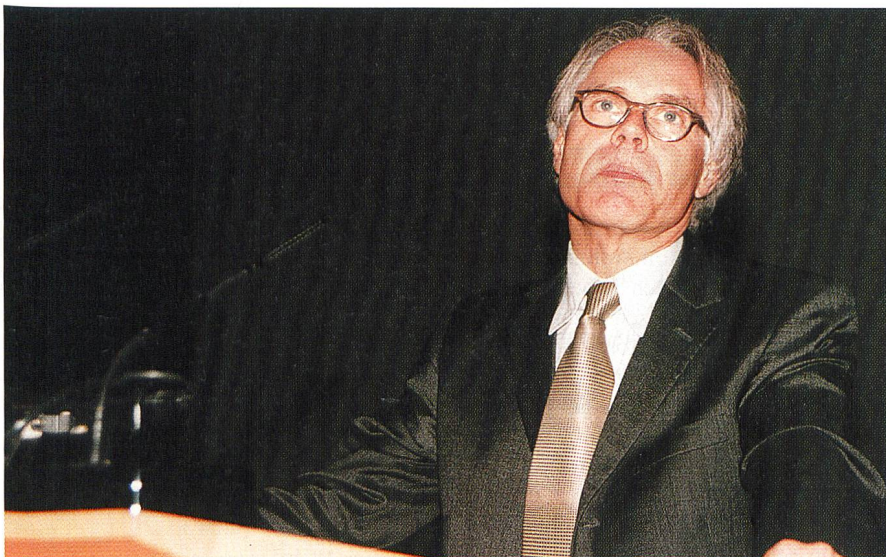
«Die Branche war dabei und hat ihre Anliegen eingebracht.»

Kleine Gemeindewerke können sich auch zu Gemeinschaften (Einkauf, Marketing, Buchhaltung, Sicherheitsinspektion, Pikette usw.) zusammenschliessen und sich so als starke Kräfte gegenüber den grossen Werken behaupten. Schlies-