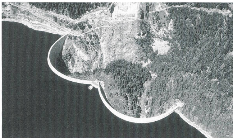
Le lac de l'Hongrin.

(m/eos) Nach einem Jahr mit umfangreichen Renovationen und Unterhaltsarbeiten werden die Anlagen der Kraftwerke Hongrin-Léman (FMHL) wieder in Betrieb genommen. Der Turbinen- und Pumpbetrieb zwischen dem Hongrinsee und dem Genfersee sind ab dem Monat August wieder operationell. Mit diesen Arbeiten mit einem Aufwand von insgesamt 6 Millionen Franken sind die FMHL wieder bereit für die Stromversorgung in der Westschweiz.