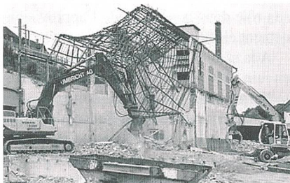
Abbruch des ehemaligen Gaswerkareals im Juli 2002 (Bild: Regionalwerke).

(rwb/wü) Die Regionalwerke Baden bauen einen neuen Werkhof auf dem ehemaligen Gaswerkareal Roggeboode. Am 2. September 2002 erfolgt der Spatenstich zum Neubau des neuen Werkhofes. Dafür investieren die Regionalwerke Baden AG 7 Mio. Franken. Zusätzlich muss vor Baubeginn das ehemalige Gaswerkareal von den immer noch vorhandenen Altlasten saniert werden. Der neue Werkhof soll spätestens im ersten Quartal 2004 in Betrieb genommen werden.