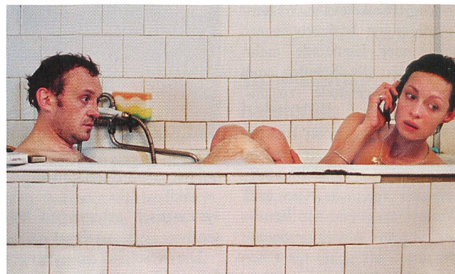
Nicht überall ist es ratsam, den Partner anzurufen (Quelle: APA OTS)

Und wenn ein Partner häufig auf Geschäftsreise muss, sorgen Rituale wie das abendliche Telefongespräch vor dem Einschlafen für ein Verbundenheitsgefühl, das die Beziehung stabilisiert. – Quelle: Für Sie