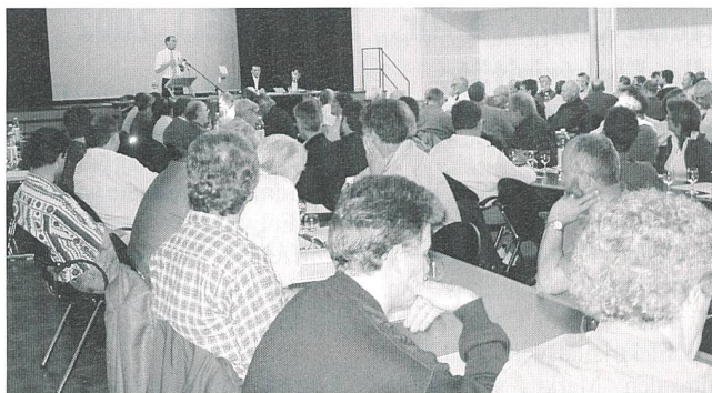
Gut besuchte VTE-Generalversammlung im schönen Gemeindezentrum von Aadorf.

Führer Expo.02, Werd Verlag, Zürich, 384 S., Broschiert, Fr. 15.–, ISBN 3-85932-388-1(d).