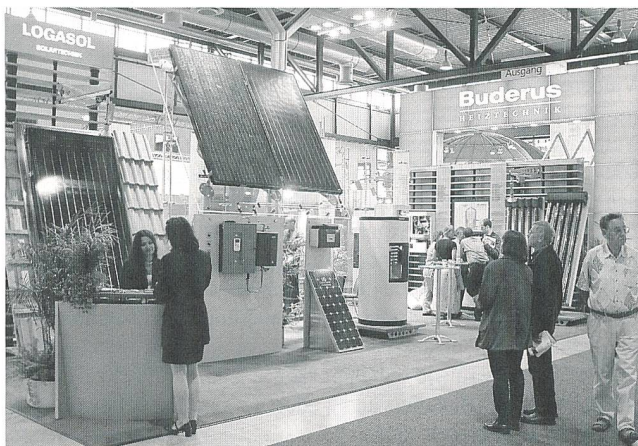
Die Fachmesse Intersolar ist das Schaufenster der internationalen Solarbranche

Solar Promotion GmbH, Postfach 100 170, D-75101 Pforzheim, Tel. 0049 7231 351380, Fax 0049 7231 351381, E-Mail: info@intersolar.de, Internet: www.intersolar.de