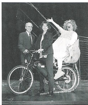
Viel Sonne im Herzen hatte Gardi Hutter bei der Preisverleihung in Solothurn.