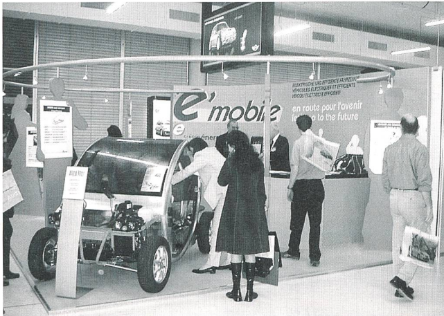
Am Stand von e'mobile wurde Information und Beratung über elektrische und effiziente Fahrzeuge und insbesondere über das neue Förderprogramm VEL2 im Kanton Tessin für solche Fahrzeuge geboten. Als Blickfang diente der Prototyp der schweizerischen Entwicklung eines elektrischen Kleinwagens mit Hochenergiebatterien und Antriebskomponenten der Firma MES-DEA in Stabio.