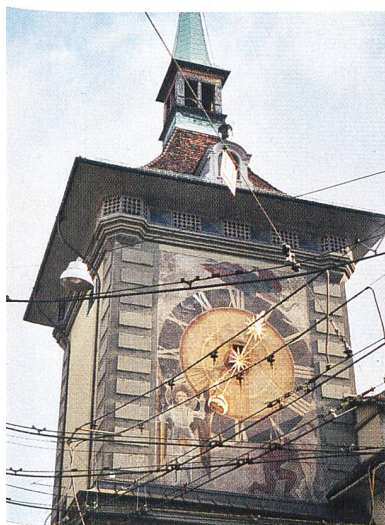
EMG-Abstimmung später (Stromleitungen) vor Zytglogenturm in Bern.

sorgungssicherheit von zentraler Bedeutung. Von verschiedenen Seiten wird gefordert, die Rolle und den Entscheidungsspielraum der Schiedskommission zu stärken und die nötigen Regelungen zeitlich gestaffelt, und nicht bereits mit der EMV, einzuführen. Damit sollen die Erfahrungen der schrittweisen Marktöffnung berücksichtigt werden.