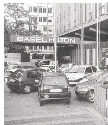
Bild: Solartankstelle vor dem Hotel Hilton in Basel während der 6-Stundenfahrt am Tag des Elektromobils '01.

und Ziel genau bei der Park & Charge-Solartankstelle neben dem Haupteingang des Hotels Hilton Basel bot der Verband e'mobile allen Interessierten Probefahrten an. Darunter war erstmals auch der Kangoo électrique.