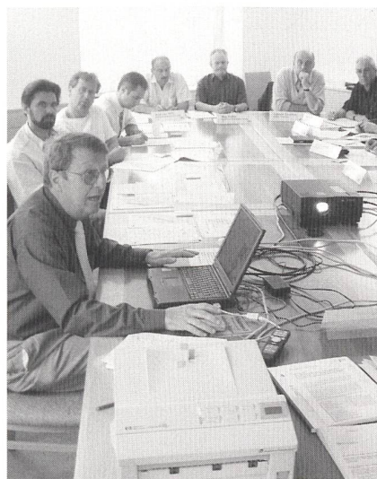
Aufmerksame Zuhörer am Einführungsworkshop Disposta am 16. Mai in Zürich.

Das auf Microsoft Access basierende Programm geht auf die frühere Störungstatistik zurück. Es dient zur Erfassung von geplanten und nicht geplanten Versorgungsunterbrüchen mit unterschiedlichen, an die jeweilige Spannungsebene angepassten Erfassungsmasken. Mit der Eingabe der einzelnen Ereignisse baut es eine Datenbank