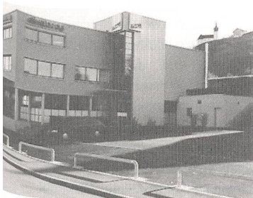
Das neue Elvatec-Gebäude in Altendorf

Auf Ende des Jahres 2000 ist nun die Elvatec AG von Schübelbach/SZ in eigene Gebäude in Altendorf/SZ umgezogen (neue Adresse: Elvatec AG, Tiergartenstrasse 16, 8852 Altendorf). Die verbesserte Infrastruktur erlaubt ab sofort auch die Durchführung von Kursen und Seminaren in eigens dafür erstellten Räumen. Selbstverständlich wird weiterhin die Unterstützung und kompetente Beratung bei Planungen und Ausführungen von EMV-Konzepten, Erdungsmessungen usw. vor Ort gross geschrieben.