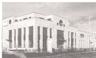
Ansicht des neuen Gebäudes der M. Züblin AG in Wallisellen

Erfolg strahlt auch der architektonisch herausragende, klassisch anmutende Firmensitz an der Winterthurerstrasse 30 in Wallisellen aus, der im letzten Herbst bezogen wurde. Das neue Gebäude ist – wie könnte es anders sein – mit allen möglichen Hightechgeräten ausgerüstet. Das Licht wird ausschliesslich von Sensoren und intelligenten Stromsparleuchten gesteuert; herkömmliche Lichtschalter sind keine vorhanden. – Kontakt: www.zublin.ch